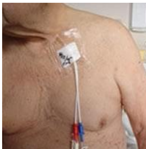
Joonis 2. Groshong kateetri kinnitamine.